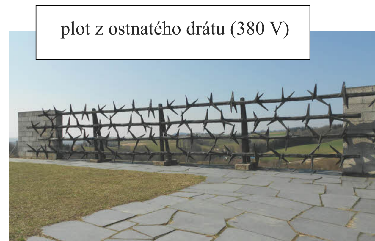
plot z ostnatého drátu (380 V)