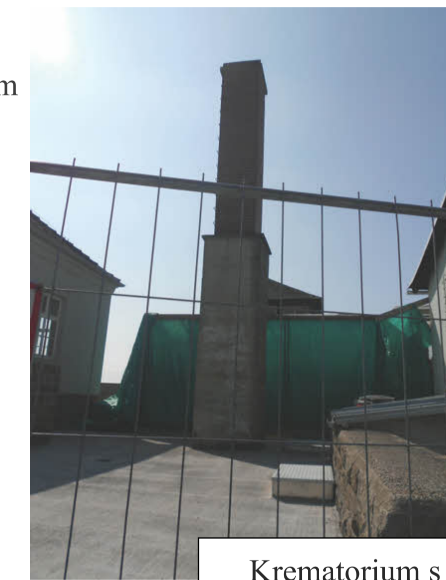
Krematorium s pecemi